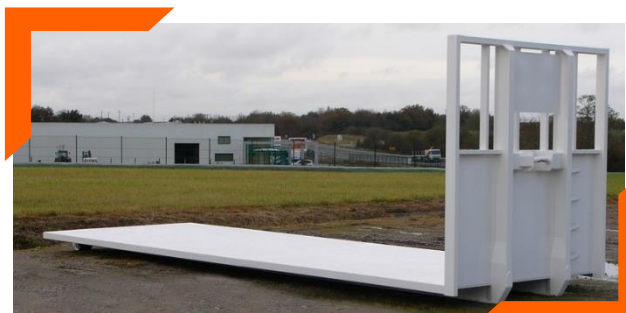
Plateau à palettes: PL7400.4.3